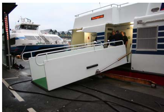
Landgang utvendig fra siden