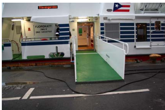
Landgang fra kaisiden

Landgangen er ca. 4 meter lang og er leddet ved skuteside, hvor den er hydraulisk hev- og senkbar avhengig av flo og fjære. Den er festet inne ved hoveddør inn til båten, som gjør at dørterskel her er eliminert. Rekkverk er trukket 30 cm utover landgangens lengde. Rekkverk i 2 høyder. Landgangen har sklisikkert belegg, men er uten tversgående stegtrinn. Dette gjør den svært lettrillende for hjul av alle størrelser. Stigning ved normalvannstand vil være ca. 1:40, men vil være avhengig av høy- og lavvann. Det vil ofte være vanlig å ha om bord- / ilandstigning over bauglandgang. Denne er også hydraulisk både i lengde og høyde, og vil under normale forhold være enkel å benytte for alle.